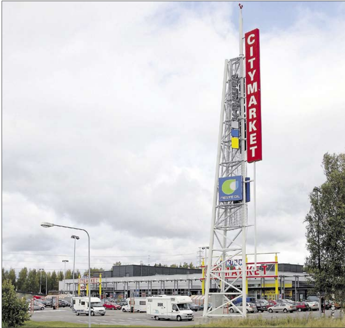
Kaupan suuryksiköiden rakentaminen on kiihtynyt viimeisen vuosikymmenen aikana. Parhailtaan tekeillä on kolme yli 100 000 kerrosneliön kaupakeskusta. Lappeenrannan Citymarketissa odoteltiin perjantaina viikonlopon ruokaostosten tektijöitä.

Raportti sai sysäyksensä, kun Vihtiin ja Pieksämäelle ryhdyttiin suunnittelemaan