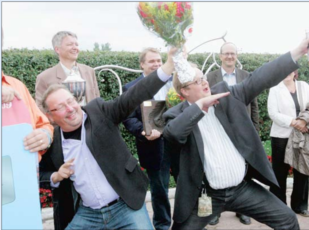
Hevosen omistaminen porukassa voi olla erityisen hauskaa. Derbyvoittaja Target Hossin omistajat näyttävät mallia.

pan purkaminen tarvittaessa on yksinkertaista: Myydään poruk- kahevonen tai ostetaan haluton osakas ulos.